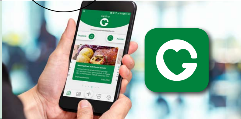
Euro-WC-Schlüssel S. 3